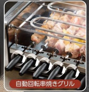
自動回転串焼きグリル